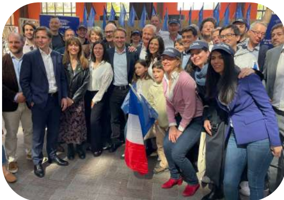
Avec mes collègues députés des Français de l'étranger