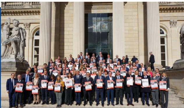
Rassemblement transpartisan des députés, à l'Assemblée nationale, pour demander la libération des otages

J'ai également rencontré les familles des otages , hommes, femmes, vieillards, bébés, enfants, adolescents dont nous attendons toujours la libération. Leur souffrance de ne pas savoir si leurs proches sont encore en vie est indicible . Suite à ce voyage, j'ai rédigé un journal de bord qui a été traduit en plusieurs langues et que vous trouverez ci-dessous.